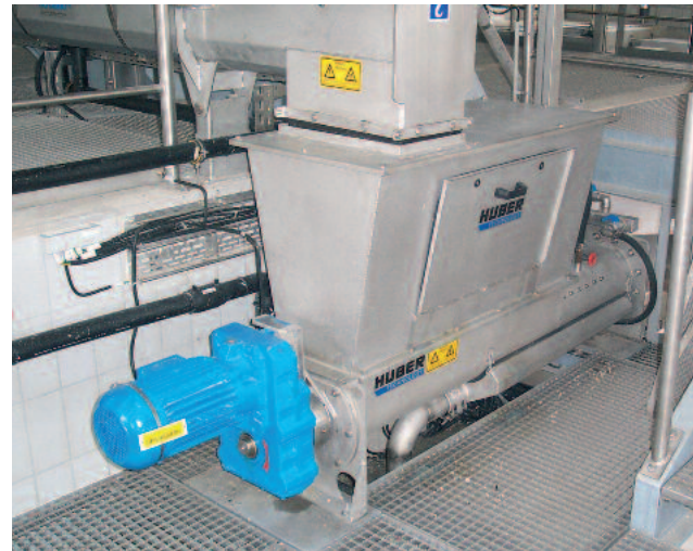
Usaldusväärne sõelmete käitlemine WAP-iga

HUBER SE Tel. + 49 8462 2010 · Faks + 49 8462 201 810 info@huber.de · Internet: www.huber.de