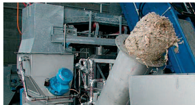
Pestud ja peaaegu lõhnavabad sõelmed HUBERi sõelmete pesupressist WAP/SL, kokkusurutud kuni 50% tahkeid aineid

HUBER SE Tel. + 49 8462 2010 · Faks + 49 8462 201 810 info@huber.de · Internet: www.huber.de