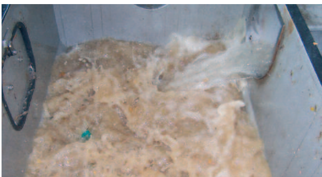
Suur turbulent pesumahutis rootori töö ajal