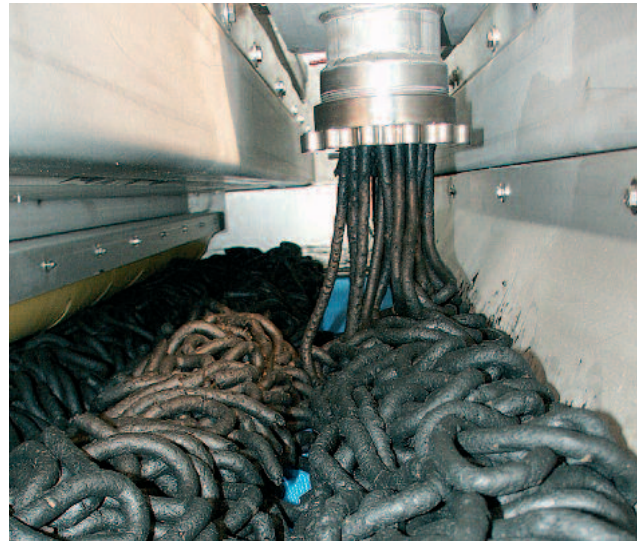
Muda etteandmine läbi meie tigupressi on peamine meie lintkuivatite silmapaistva töö jaoks

Reoveemuda kuivatamine peab vastama mitmetele vastuolulistele nõudmistele: majanduslik tõhusus, elektritoide, tootele esitatavad nõudmised, utiliseerimise ohutus ja võimalused. Reoveemuda kuivatamine vähendab selle massi, kogust ja utiliseerimiskulusid. Toodetud kuivad ja desinfitseeritud bioloogilised tahked ained on väärtuslikud, mida saab kasulikult tarvitada. Kuivatamiseks vajaliku soojuse saamiseks on võimalik kasutada erinevaid energiaallikaid. Me otsustasime kuivatada keskmistel temperatuuridel, kuni 145° C, kuna need temperatuurid on piisavad kindlustamaks kiiret kuivamist ja võimaldavad samas kuluefektiivset ning keskkonnasõbralikku heitsoojuse utiliseerimist. Kuivati õhu sisemine taaskasutamine kondensaatoriga koos sisseehitatud soojuse taastootmisega vähendab kuivati soojusevajadust veelgi.