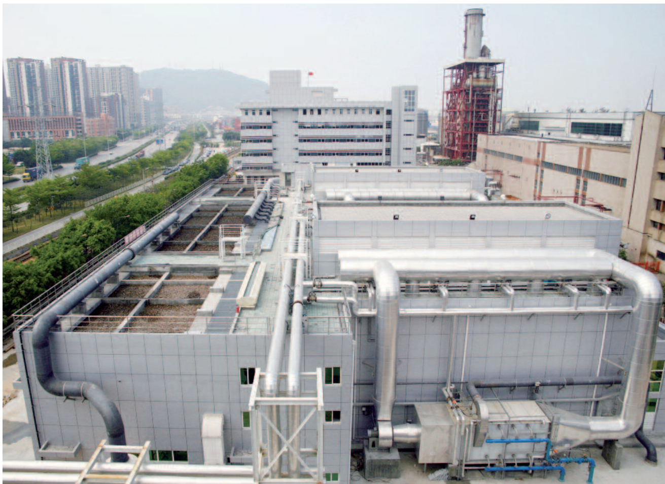
Suuremahuline reoveemuda kuivatusjaam koos väliste kondentseerimisüksuste ja biofiltritiga

HUBER SE Tel. + 49 8462 2010 · Faks + 49 8462 201 810 info@huber.de · Internet: www.huber.de