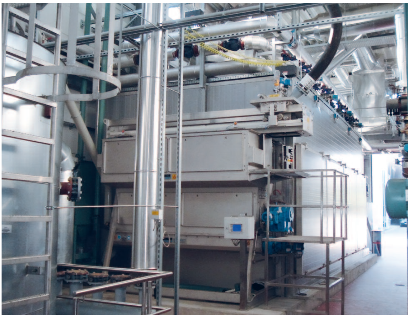
HUBERi lintkuivati BT: märgmuda etteandmine läbi granulaatori, kuiva materjali väljumine läbi horisontaalse eemalduskruvi